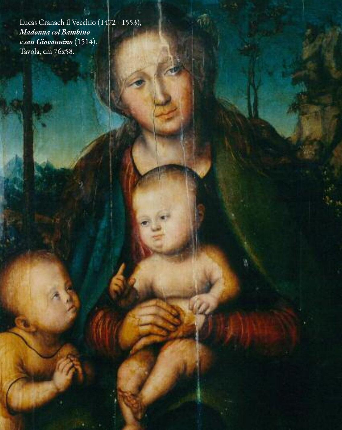
Lucas Cranach il Vecchio (1472 - 1553), Madonna col Bambino e san Giovannino (1514). Tavola, cm 76x58.

Trafugata nel 1973 dalla Certosa del Galluzzo (FI) e recuperata nel 2000 a Torino in uno studio d'arte, dal Comando CC TPC. Attualmente si trova a Firenze, nella Galleria degli Uffizi.