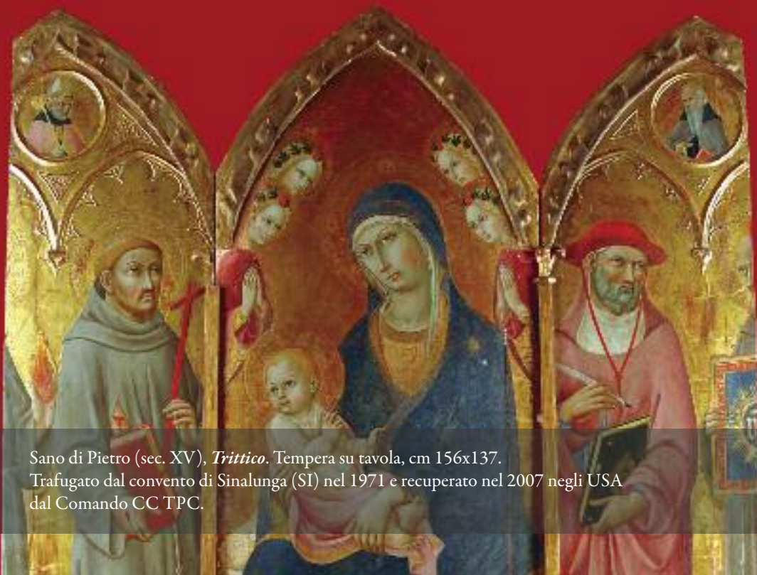
Sano di Pietro (sec. XV), Trittico . Tempera su tavola, cm 156x137.

L'esito di questo lavoro è consultabile online attraverso il portale BeWeb – Beni ecclesiastici in Web, all'indirizzo www.chiesacattolica.it/beweb .